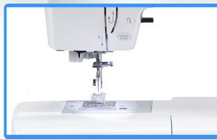
Luz LED, boton se STAR/STOP