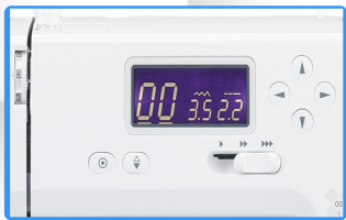
Pantalla LCD retroiluminada con botones de selección rápida.